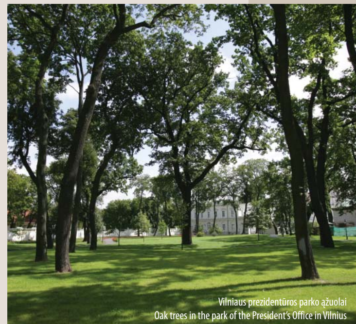
Vilniaus prezidentūros parko ąžuolai Oak trees in the park of the President's Office in Vilnius