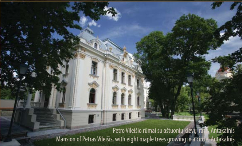
Petro Vileišio rūmai su aštuonių klevų ratu, Antakalnis Mansion of Petras Vileišis, with eight maple trees growing in a circle, Antakalnis